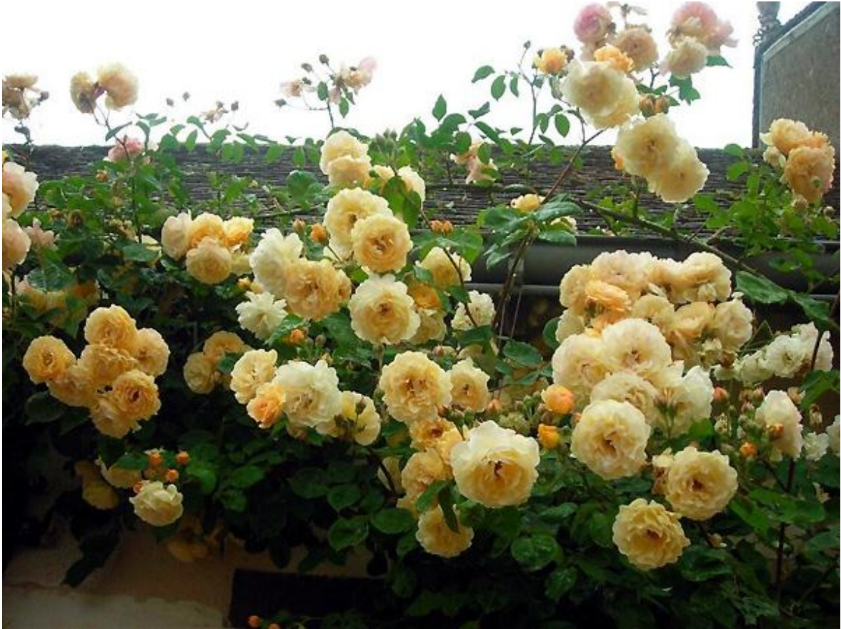
'Buff Beauty' - Hybride de moschata (1939) - Cliché : jardin de particulier ©