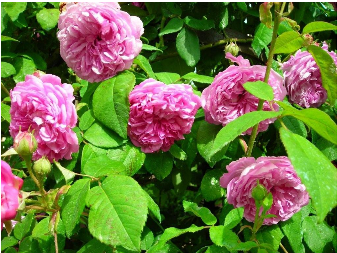
'Olivet' - Hybride de multiflora (1892)