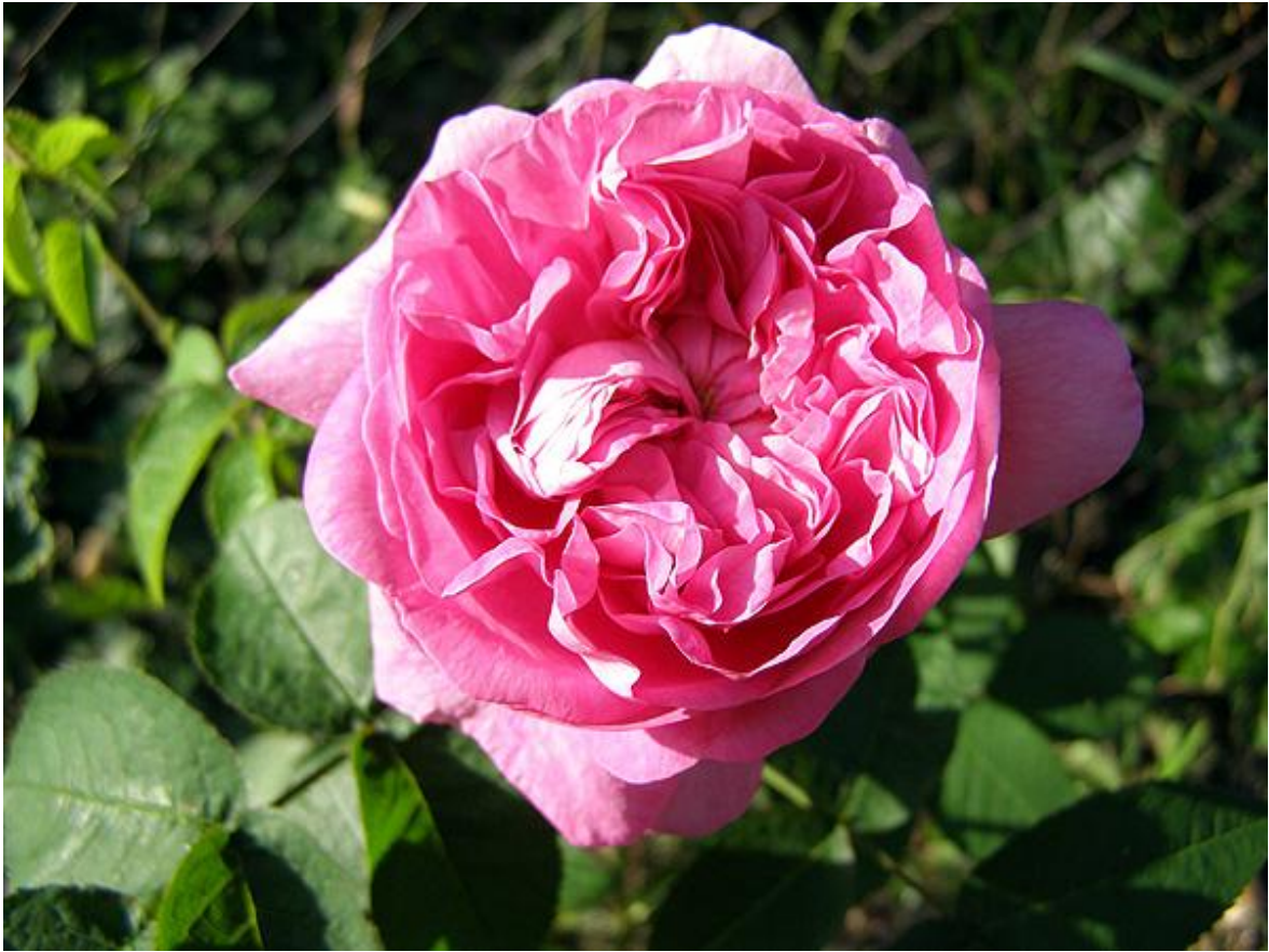
'Marie-Louise' - Rose de Damas (avant 1813)