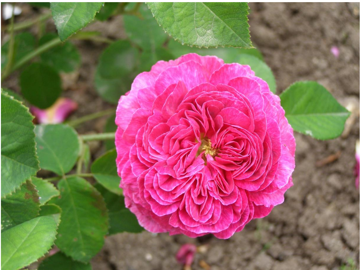
'Manteau pourpre' - Gallique (avant 1810)