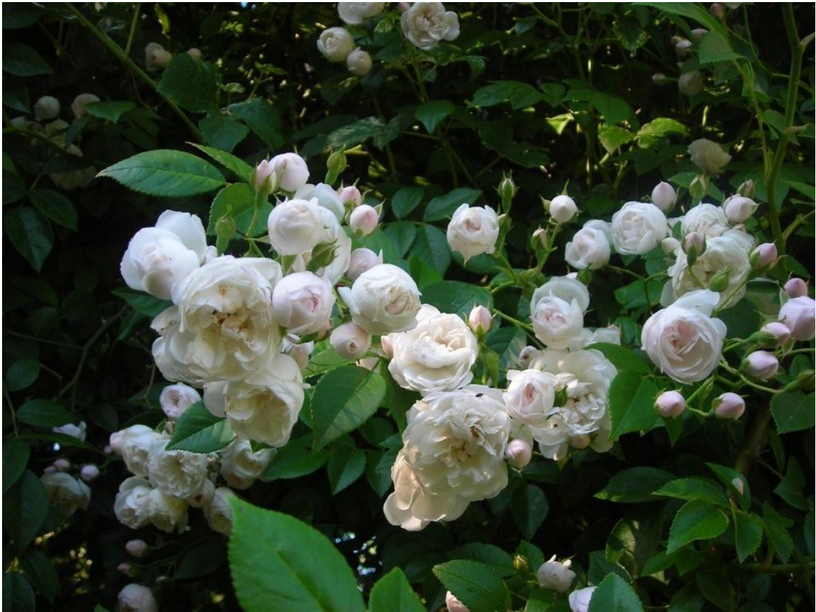
'Princesse Marie' - Hybride de sempervirens (1829) - Cliché : jardin de particulier ©