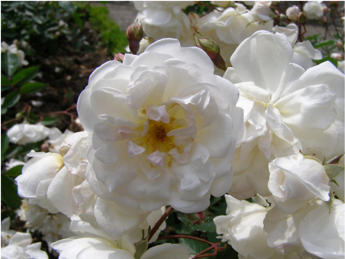
'Marie Pavic' (ou 'Marie Pavié') - Polyantha (1888) - Cliché : jardin de particulier ©