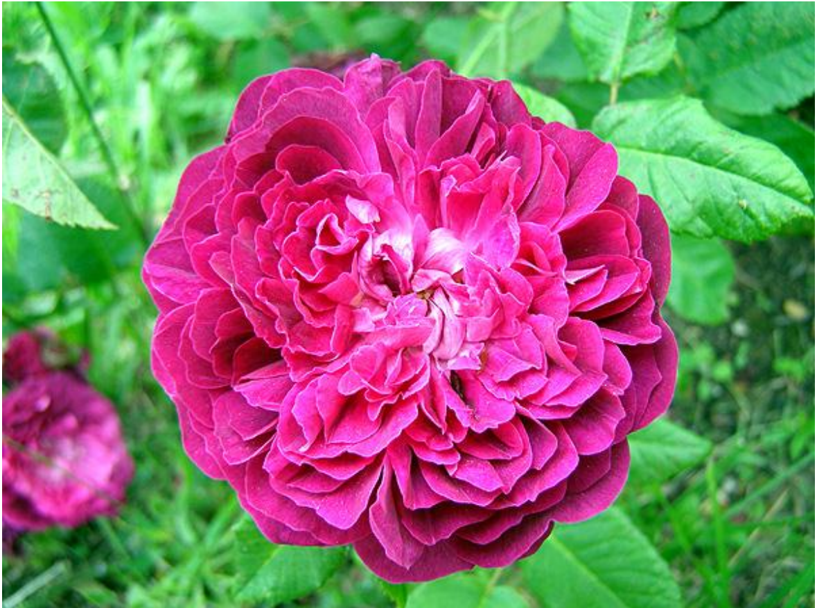
'Souvenir de Mon Ecole' - Gallique (origine inconnue) - Cliché : jardin de particulier ©