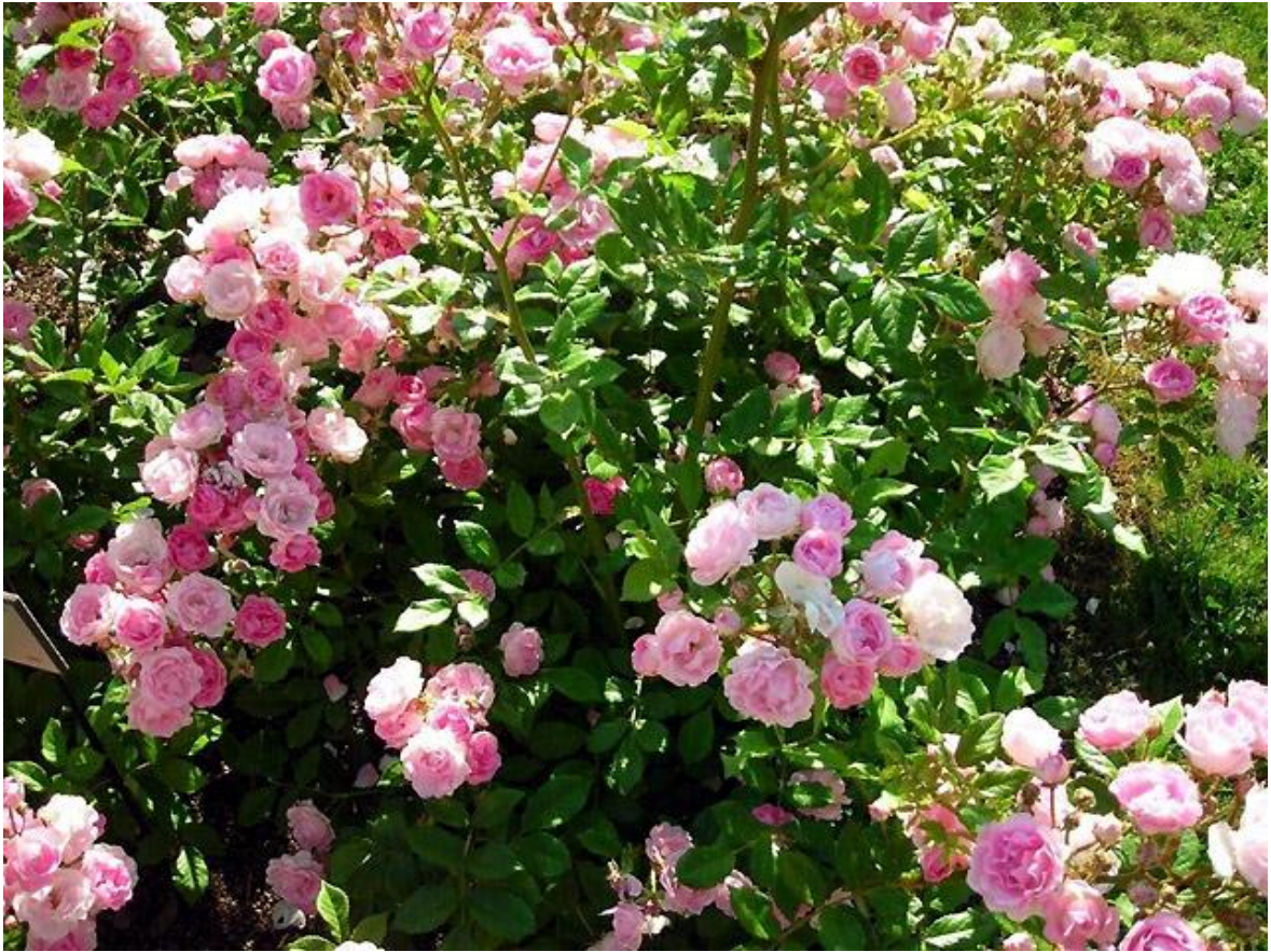
'Maman Turbat' - Polyantha (1911)